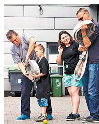
Jak se stát hasičem?

Novinkou je letos stanoviště Finanční plánování , které absolvují děti od 17 let. Toto stanoviště bude umístěno na centrále Modré pyramidy a ujmou se ho finanční školitelé. „Rádi bychom vybrali z týmů nejstarší děti, pro které bychom na dopoledne připravili hru zaměřenou na finanční plánování. Měla by jim rozšířit obzory v této oblasti. Čeká je odchod do reality a získané informace by jim mohly pomoci do rozjezdu,“ doplňuje organizátorka Klára Chábová. dom