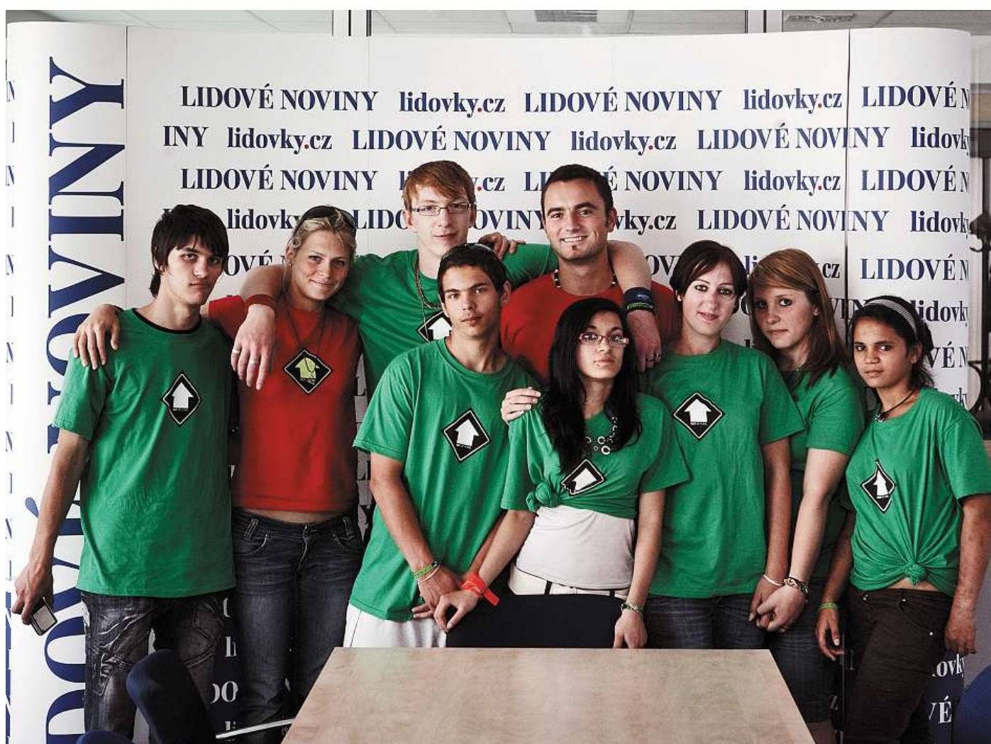
Team z Horní Čermné v Lidových novinách